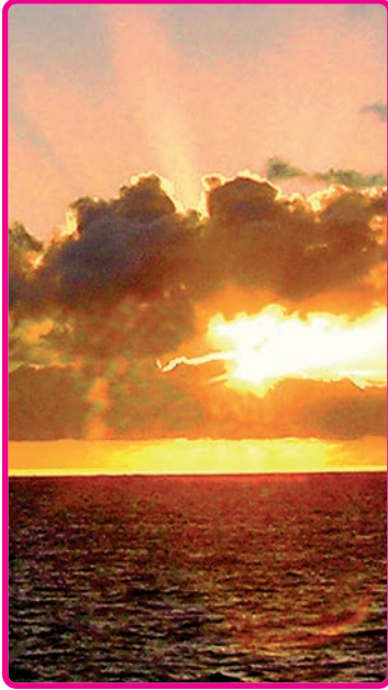
TITEL: Quelle DIMENSION: Transpersonale Karte URHEBERIN: Seena B. Frost

Form und deshalb auch keine potenziellen Schatten. Sie haben auch keine Stimme, die wir erahnen könnten, deshalb sprechen wir in Readings nicht von ihnen.