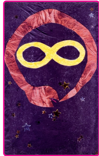
TITEL: Zeuge DIMENSION: Transpersonale Karte URHEBERIN: Nancy Weiss

Gestalte eine Karte für den Zeugen . Die Bilder für diese Karte geben einen gewissen Eindruck, der sich auf das allsehende Auge des Bewusstseins und dessen reflektierende Natur bezieht. Diese Karte erhält dieselbe spezielle Rückseite wie die anderen transpersonalen Karten und wird während eines Readings ebenso in die Mitte gelegt.