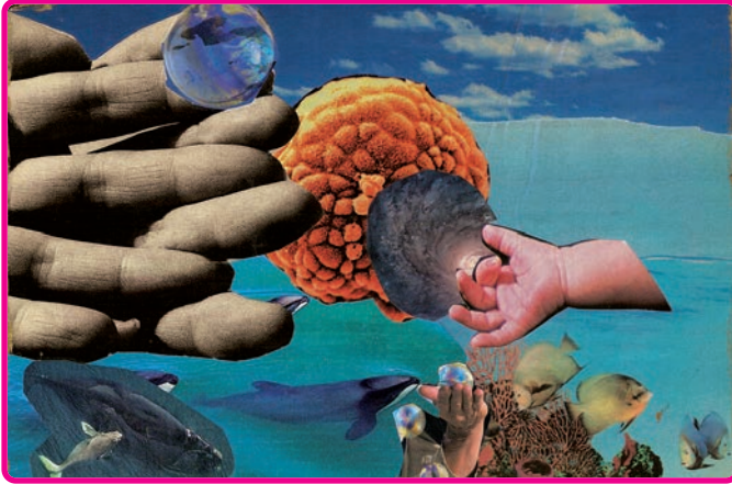
TITEL: SeelenEssenz DIMENSION: Transpersonale Karte URHEBERIN: Imelda Maguire

Eine Karte, die deine SeelenEssenz repräsentiert, kann durchaus komplexer sein und mehr Bilder enthalten als deine Quelle -Karte. Ein Foto aus der Kindheit könnte zum Beispiel integriert werden, denn die SeelenEssenz ist in unseren frühen Kinderjahren noch sehr sichtbar, bevor sie von prägenden Erfahrungen tendenziell verschleiert wird. Mein Hintergrundbild für diese Karte ist dasselbe wie bei meiner Quelle -Karte, weil ich davon ausgehe, dass die SeelenEssenz direkt aus der Quelle entspringt.