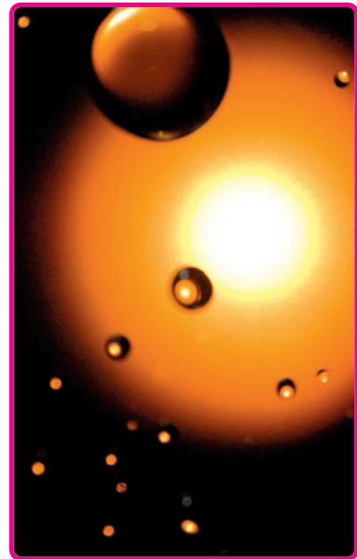
TITEL: Quelle DIMENSION: Transpersonale Karte URHEBERIN: Catherine Anderson

Die drei transpersonalen Konzepte, wie ich sie oben beschrieben habe, werden in vielen mystischen Traditionen erwähnt und wahrscheinlich erkennst du sie wieder. Mach dir keine Sorgen, wenn die Begriffe, die ich verwende, nicht mit denjenigen übereinstimmen, die du kennst. Was ich hier unterstreichen möchte, ist, dass die Realität, über die ich hier schreibe, eigentlich jenseits ist von jeder Definition – es ist ein Mysterium, heilig und formlos. Die Bilder, die wir benutzen, um dieses Mysterium zu repräsentieren, können, wie wir wissen, nur inadäquate Symbole sein, die auf dieses Einssein hinter dem Vielfältigen hinweisen. Deine drei Transpersonalen Karten sind keine Repräsentanten der Neteru wie deine anderen Karten. Diese drei Karten haben keine